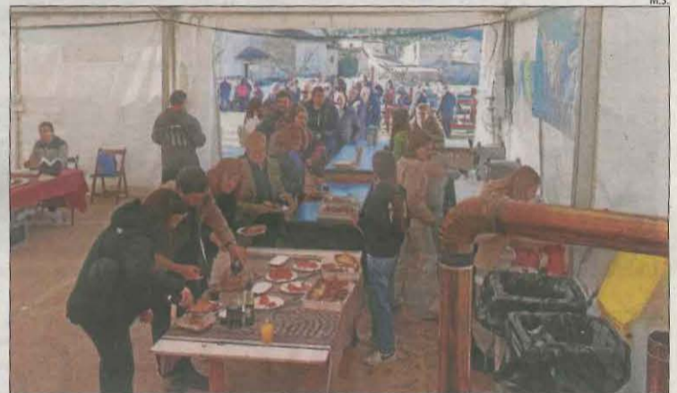
La fira també va oferir tota classe de productes de proximitat.

Prèvia a la fira, dissabte es va celebrar una jornada tècnica sobre les característiques de l'olivera de muntanya.