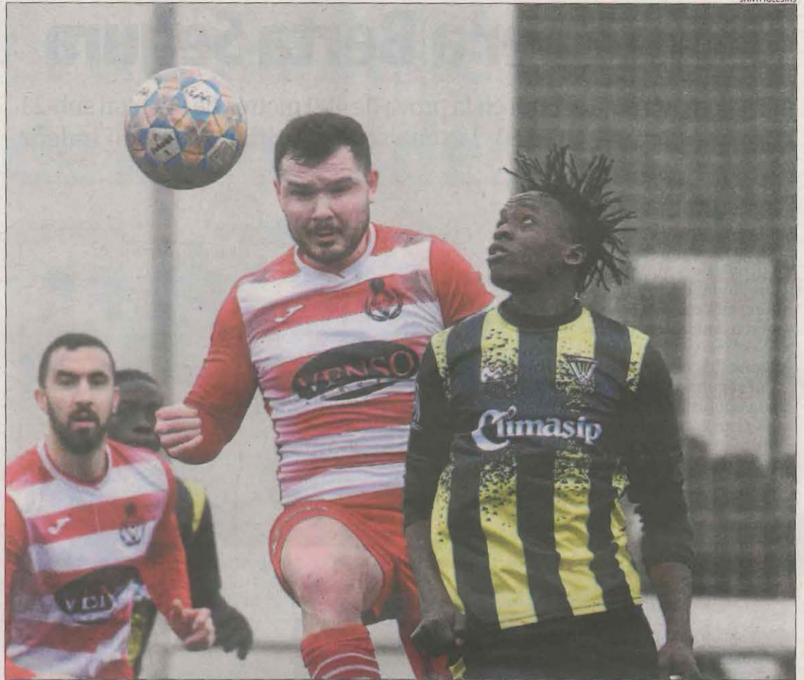
Un jugador de l'Almacelles i un del Pardinyes B es disputen la pilota.

ALMACELLES | L'Almacelles va sumar una victòria important contra el Pardinyes B que li permet seguir líder de grup (2-0). A la primera part l'Almacelles va deixar sentenciat el partit amb dos gols de córner. A partir d'aquí, els locals es van dedicar a mantenir el resultat davant d'un Pardinyes B que ho intentava però que no aconseguia generar gaire perill. A la segona meitat, la tònica va ser la mateixa. Els locals van controlar el joc mentre que els visitants van continuar imprecisos i van acabar el matx sense fer efectiva ni una sola rematada. Amb la victòria, l'Almacelles segueix primer amb 38 punts, a dos del segon classificat, l'Albagés, i a tres de l'Albi.