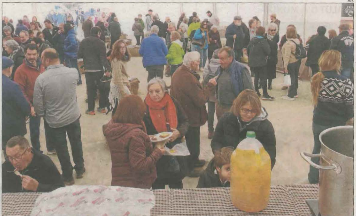
Els assistents a la Fira d'Aramunt van poder degustar l'oli que es produeix al Pallars Jussà.

El certamen compta amb el suport de l'Associació de Productors del Pallars per recuperar varietats