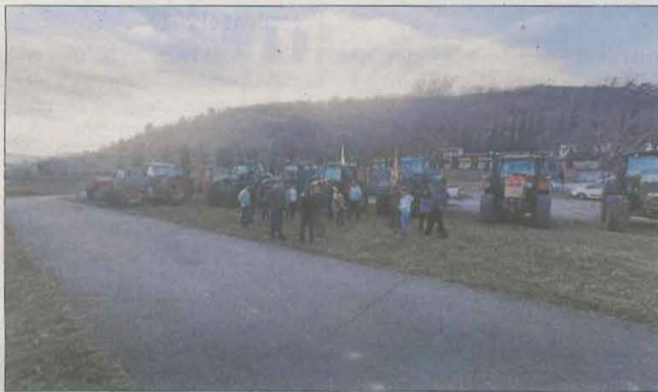
Pagesos abans de començar la mobilització a la C-13 a Tremp.