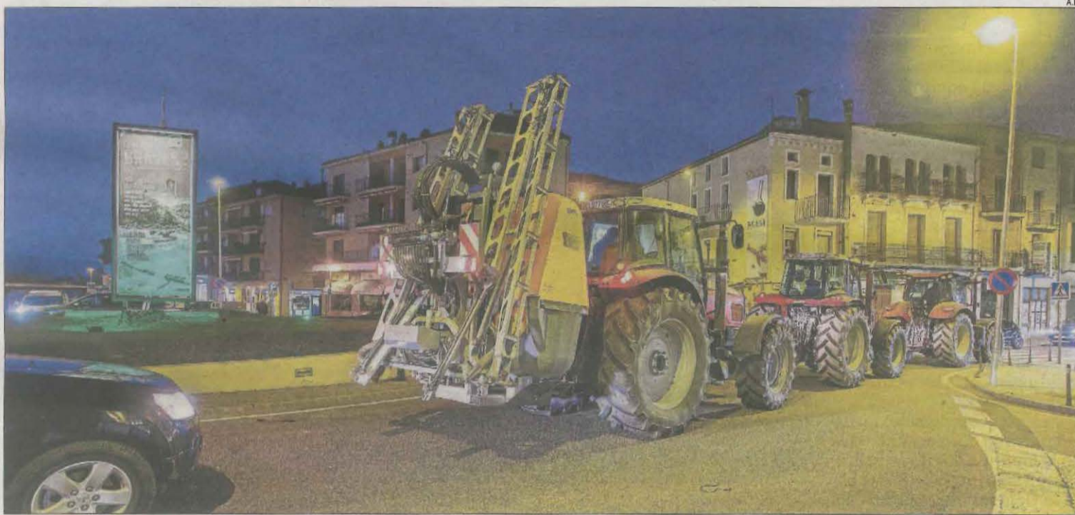
Tractors desfilant per la C-14 a l'entrada de Ponts, a la Noguera.

A Agramunt van cremar pneumàtics, la qual cosa va tallar la circulació uns 40 minuts a última hora de la tarda. Les comitives van estar controlades pels Mossos. Fonts del sector van indicar que s'anava informant els conductors, que "en la majoria dels casos es van mostrar comprensius amb la situació". Les primeres mobilitzacions sorpresa es van registrar divendres.