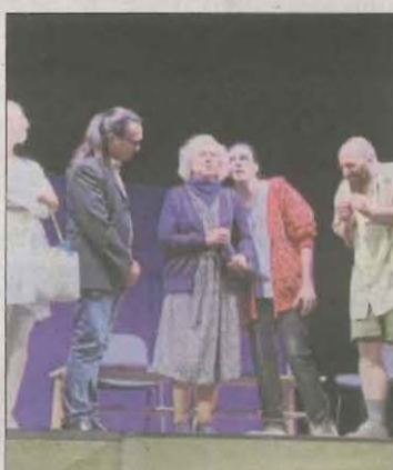
La companyia Talia Teatre oferirà el seu espectacle demà a la tarda.

I picant l'ullet a la història, es presentarà un llibre amb fotos antigues de la localitat, recopilades per Cassimir Baró.