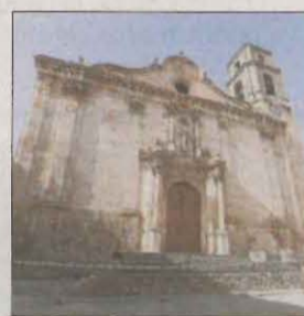
Oficiaran misses per la Candelera i Sant Blai.

17.00 Animació infantil amb Salta, Canta i Balla. Al local social.