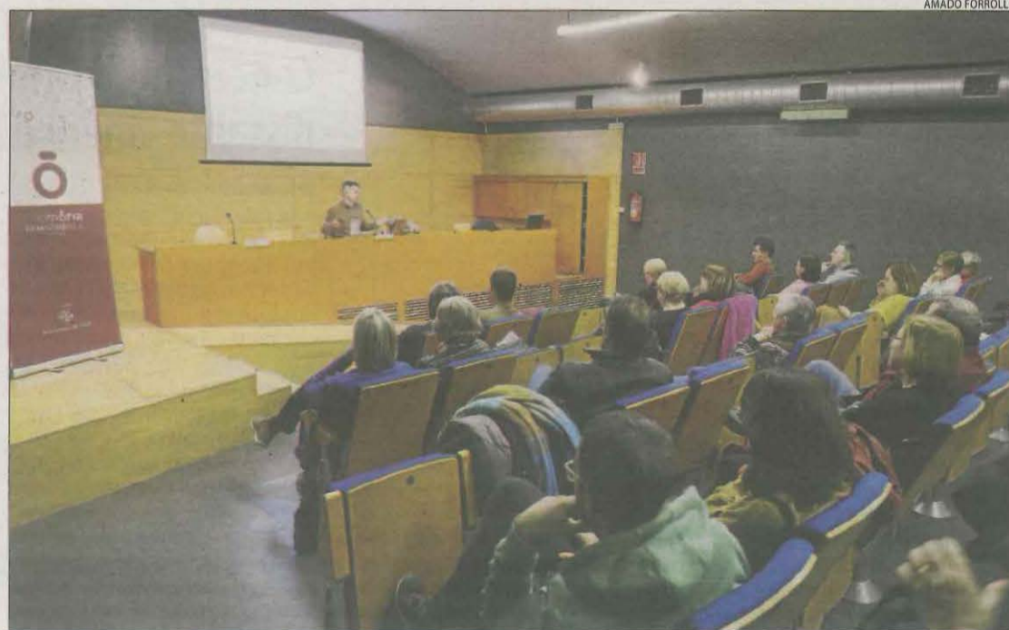
Conferència sobre memòria històrica ahir a la Sala Jaume Magre de Lleida.

FLIX | Prop de 200 estudiants de més d'una vintena de centres de Secundària catalans, entre els quals l'Institut de Tremp, es van reunir ahir a Flix per honorar les víctimes de l'Holocaust. La trobada va ser la culminació del projecte La fragilitat de la llibertat , amb el qual els alumnes van treballar diferents biografies de persones que es van rebel·lar contra la ideologia nazi i els totalitarismes del moment i van elaborar una peça artística vinculada a aquestes històries de vida, com collages, dibuixos o muntatges audiovisuals. A partir d'aquestes aportacions teòriques i creatives, l'artista