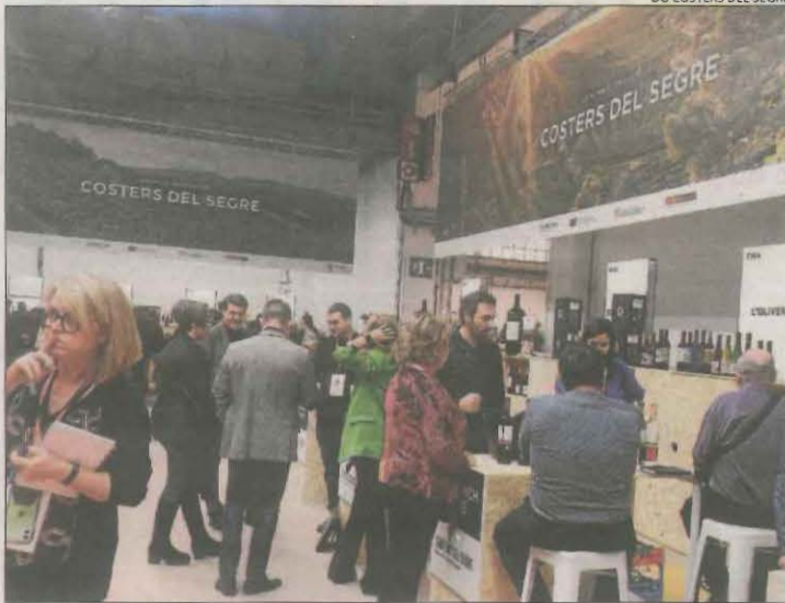
La DO Costers del Segre, a la Barcelona Wine Week del 2023.