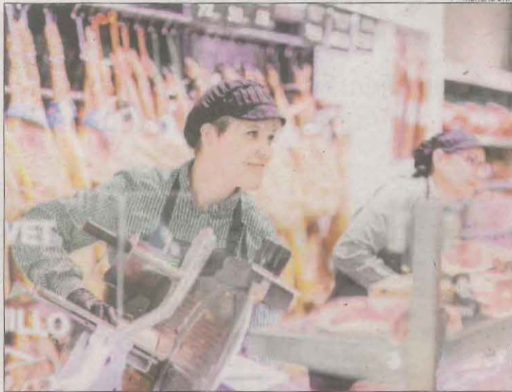
Treballadores de la secció de xarcuteria, en una de les botigues.

Segons la cadena, "aquesta mesura fa patent que les tre-