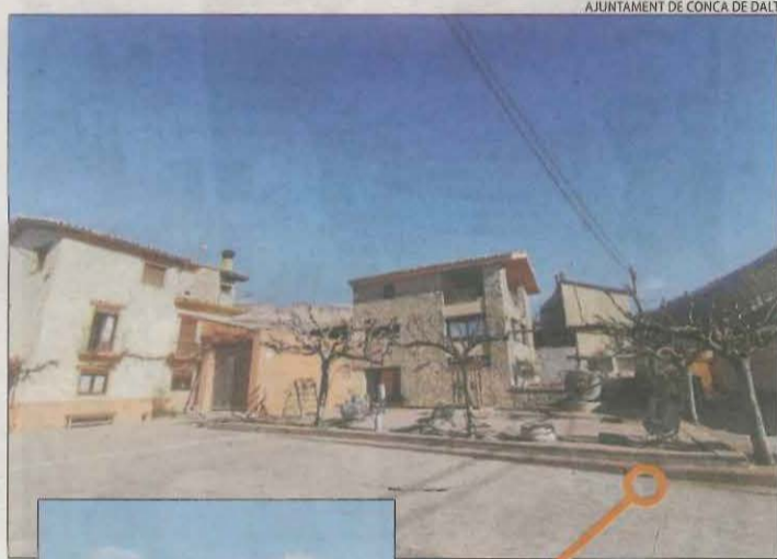
AJUNTAMENT DE CONCA DE DALT