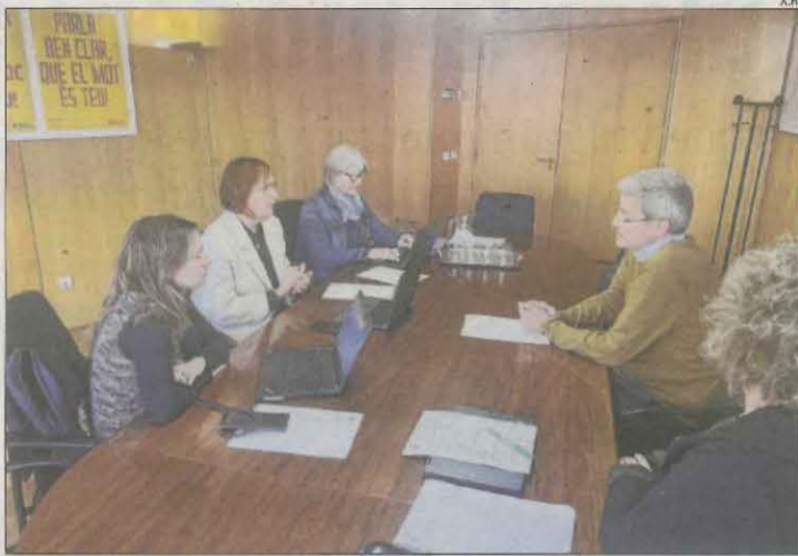
La reunió d'ahir entre Ars i Bergés.

Després de la reunió, el primer edil també va demanar